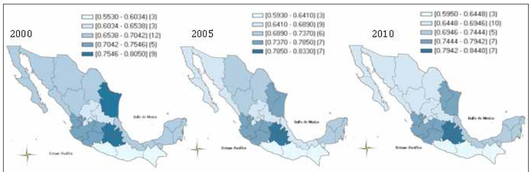
Mapa No. 2. México: Índice de Desarrollo Regional Sostenible