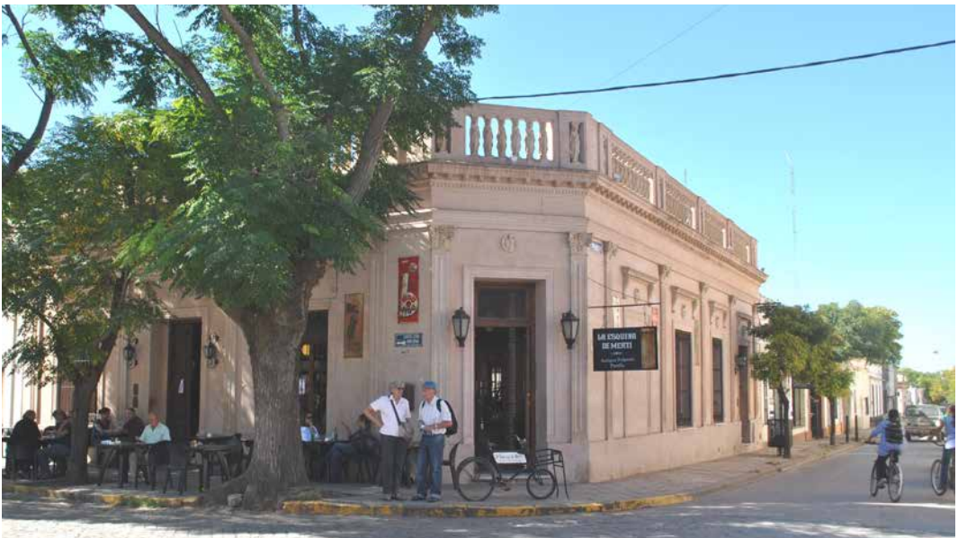
Figura 5. Bar "La esquina de Merti" frente de la plaza central (restaurado). Se puede observar la arquitectura local, el empedrado y los faroles adosados.

"Esto es fantástico, vos te venís acá un mes y te hacés un tratado de cómo es la pelea entre como quedarse parado en 1920 y vivir como en 1920. El intendente que estaba antes que Paco vivía como en 1920. No daba agua, no daba luz, no daba gas, no daba teléfono, no daba cable y el pueblo se acababa acá a 3 cuadras..." (Locutor, entrevista 25, 2013).