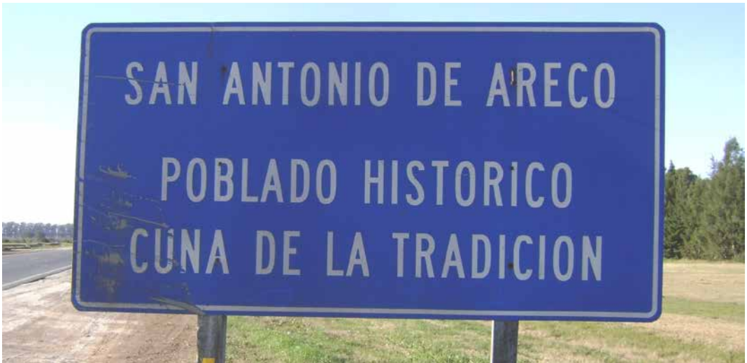
Figura 2: San Antonio de Areco “cuna de la tradición”. Cartel ubicado a metros de la entrada a la ciudad de San Antonio de Areco

El escritor Ricardo Güiraldes (1886-1927), poseía una estancia de propiedad familiar, denominada La Porteña, en la localidad de San Antonio de Areco. Allí pasaba sus días de ocio durante su infancia/juventud, lo que posibilitó conocer diferentes aspectos sobre “la vida” y el “hombre de campo”. Esta experiencia lo inspiró a escribir, años más tarde en París, su obra célebre “Don Segundo Sombra” (1926). Tras su muerte en 1927, y debido al éxito del libro, su hermano, Antonio Güiraldes (1887-1947), siendo intendente de San Antonio de Areco, impulsó la creación del Parque Criollo y el Museo Gauchesco “Ricardo Güiraldes”. Se inauguró en 1938 y contó con el apoyo político local y provincial y parte de la comunidad arequera. El objetivo del Parque y Museo era homenajear la figura del Gaucho y del fallecido escritor.