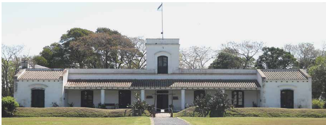
Figura 4: Vista actual del Museo Gauchesco “Ricardo Güiraldes”

En los discursos inaugurales del Parque y Museo, Bustillo afirmaba: “Con estas obras que hoy inauguramos, el gobierno de Buenos Aires, interpretando arraigados sentimientos populares, rinde culto a tradiciones nacionales que siempre se evocan con singular simpatía. Al mismo tiempo honra la memoria de un argentino que empleó sus dotes sobresalientes de escritor en describir costumbres... También ha querido el gobierno ofrecer al pueblo trabajador y modesto un lugar apacible y tranquilo, de reposo espiritual, donde pueda conocer el realismo de evolución social argentina, con la reconstrucción fiel de una vieja estancia criolla...” (Lecot, 1967: 43).