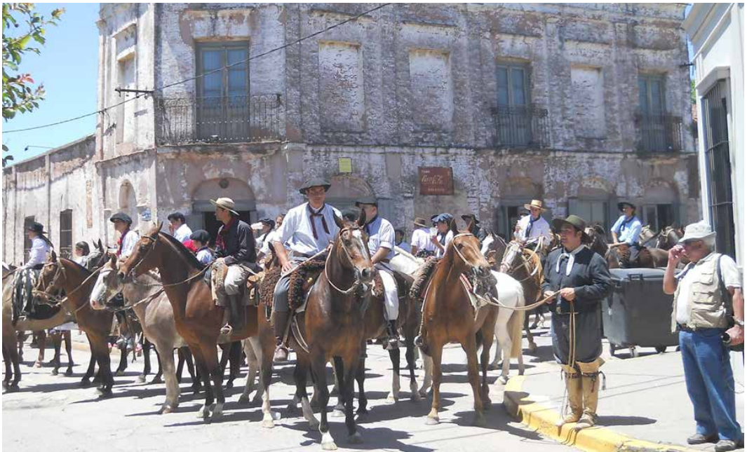
Figura 3: Centros tradicionalistas en la esquina del histórico bar Bessonart (“Lugar Significativo” 2005) en el desfile el día de la Tradición. Noviembre 2013

serie de medidas fueron implementadas. Se formularon políticas de preservación patrimonial. Se definió y puso en valor el centro histórico de la ciudad; y se creó la categoría de declaración municipal “Lugar Significativo”. El primer año de su aplicación, 1970, se reconocieron 18 propiedades, de las cuales 10 se relacionan con la familia Güiraldes o a lugares vinculados con la historia del Don Segundo Sombra. Uno de esos casos fue el Museo Gauchesco Ricardo Güiraldes, declarado en 1970, y que en 1999 fue reconocido como “Monumento Histórico Nacional” (Decreto Nacional 1305/99), por la CNMMLH. Desde lo turístico, se promovió el establecimiento de servicios de alojamiento y gastronomía; y la Fiesta de la Tradición (Figura 3) pasó a conformarse como uno de los atractivos 1 más relevantes de San Antonio de Areco. Este tipo de acciones continuaron consolidándose entre las décadas 1990 y del 2000. Se acrecentó el repertorio patrimonial municipal y se buscó aumentar las escalas de determinados elementos significativos. En 2001 se iniciaron los trámites promover a San Antonio de Areco como “Patrimonio de la Humanidad” desde la UNESCO (Ordenanza 1/01). En el 2014 la tumba de Ricardo Güiraldes, localizada en el cementerio de la ciudad, se declaró “Sepulcro Histórico Nacional” por la CNMMLH (Decreto Nacional 186/2014).