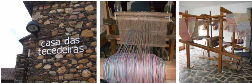
Figura 5. Casa das Tecedeiras