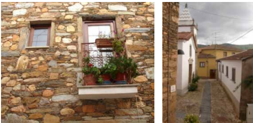
Figura 3. Arquitetura da aldeia

Janeiro de Cima é uma Aldeia do Xisto localizada no Interior Centro de Portugal, pertencente ao Município do Fundão. De acordo com dados do INE (2011), esta aldeia tem 306 habitantes, sendo uma das Aldeias do Xisto com mais população. O xisto, uma rocha metamórfica usada na construção tradicional na aldeia, confere a este território um carácter único. Além disso, o facto de pertencer à Rede das Aldeias do Xisto, inserida num programa de financiamento público destinado à preservação do património da aldeia, confere uma marca turística distintiva ao território. Janeiro de Cima destaca-se também pela construção tradicional que utiliza o xisto misturado com pedra rolada do rio, tal como ilustra a Figura 3.