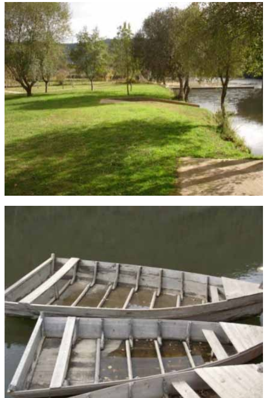
Figura 4. Parque fluvial e barco de rio tradicional

A aldeia de Janeiro de Cima está enquadrada num ambiente natural, com destaque para o rio Zêzere, tendo uma longa tradição na construção de barcos de rio, localmente designadas por “barcas” (Figura 4). O parque junto ao rio é um espaço de destaque na aldeia, atraindo muitos turistas no verão, assim como a realização de eventos.