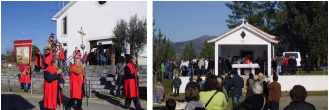
Figura 6. Festa de São Sebastião, em 2011